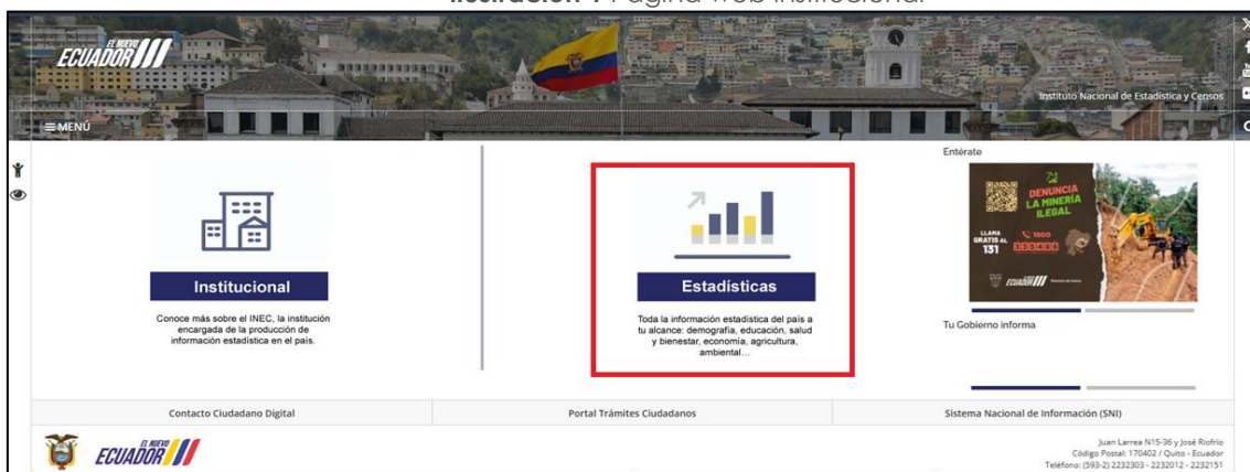
Ilustración 1 Página web institucional