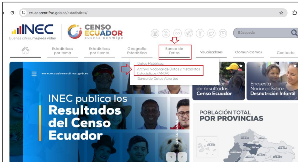
Ilustración 2 Acceso a banco de datos