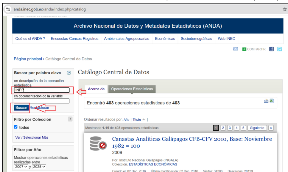
Ilustración 3 Archivo Nacional de Datos y Metadatos Estadísticos (ANDE)