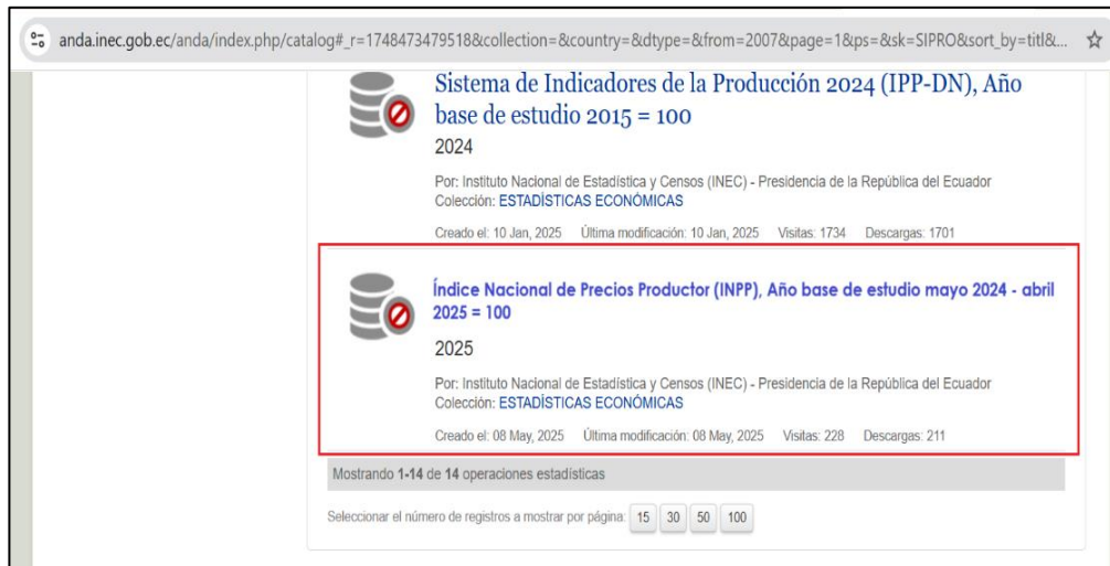
Ilustración 4 Micrositio del Índice Nacional de Precios Productos en el ANDA